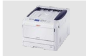
OKI PRO8432WT MAX: DIN A3XL