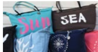
LASER-DARK (NO-CUT) LITE