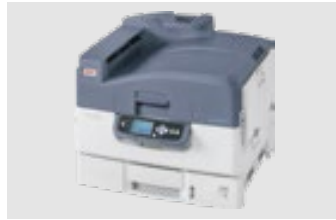
OKI PRO920WT ES9420WT/C920WT MAX: DIN A3XL