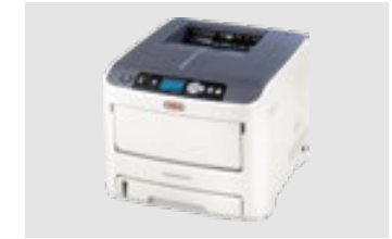
OKI PRO6410 NEON MAX: A4XL