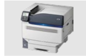
OKI PRO9541WT MAX: DIN A3XL