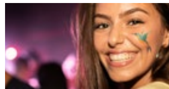
LASER TATTOO PAPER