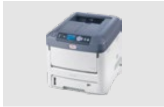
OKI PRO7411WT ES7411WT/C711WT MAX: DIN A4XL